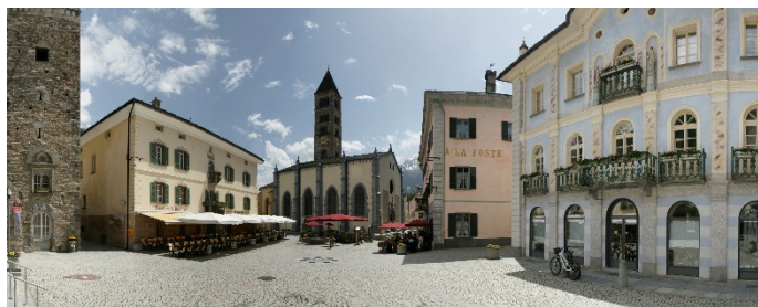
Piazza di Poschiavo

12:55 Ci troviamo in stazione a Poschiavo.